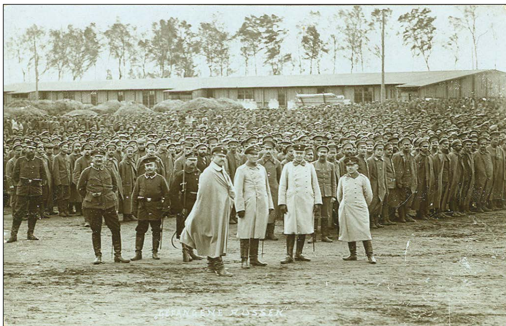
Ryc. 1. Obóz jeniecki w Stargardzie na pocztówce Maxa Dreblowa, 1914 r. Zbiory MAH w Stargardzie