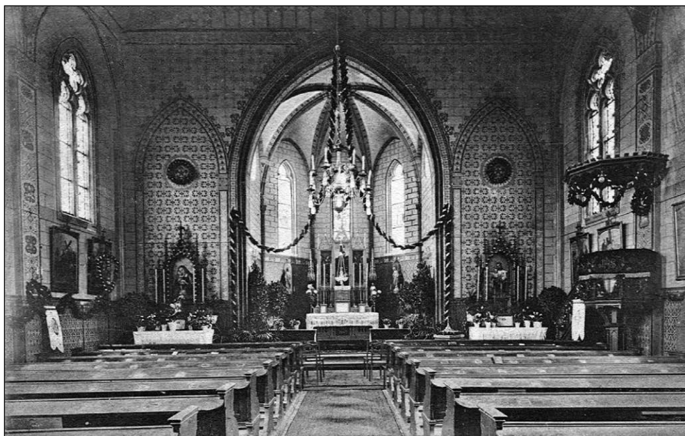
Ryc. 6. Pocztaówka przedstawiająca wnętrze kościoła św. Józefa w Stargardzie.