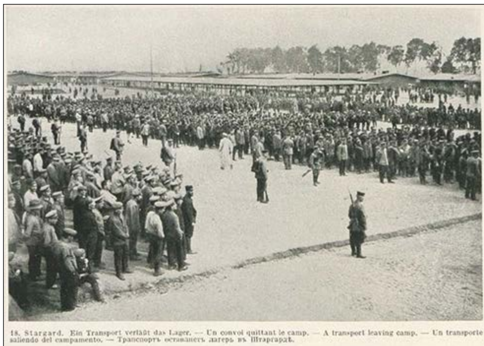
Ryc. 2. Jeńcy na placu obozowym w Stargardzie (wg Backhaus 1915) Backhaus 1915